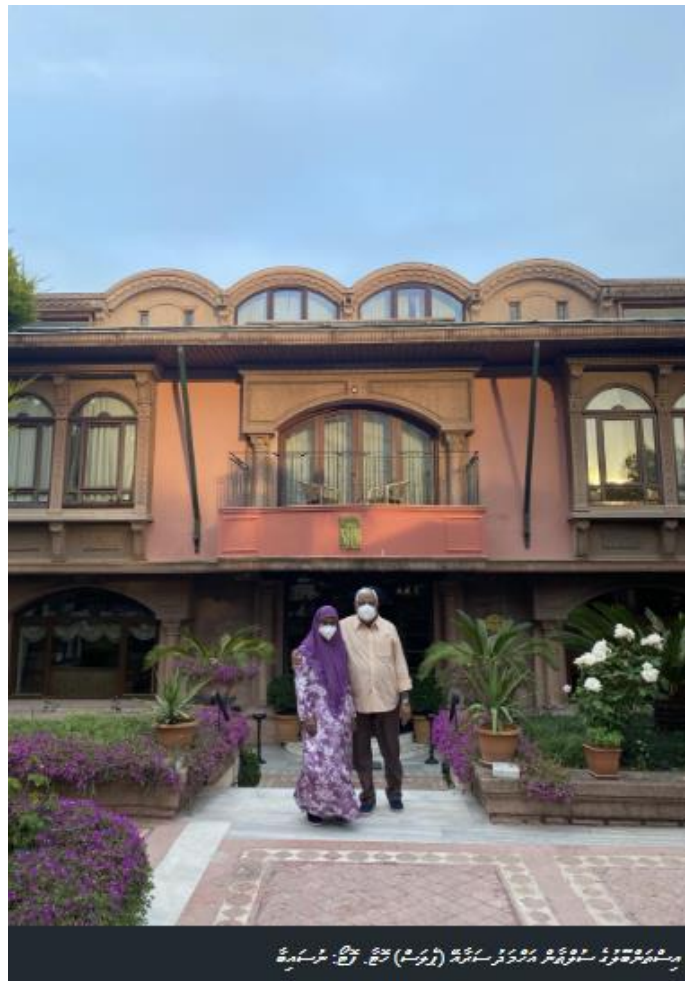
د پاکستان د سولې د شورا د کمیټې د (ژوند) د خپلې لټونې