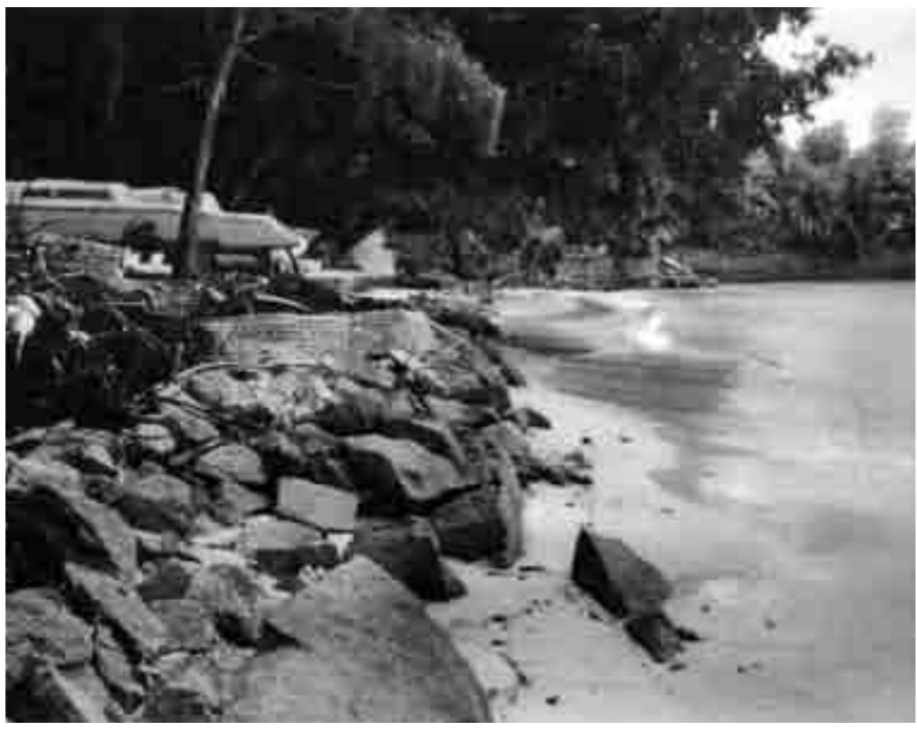
הגנה זמנית מפני שטפונות