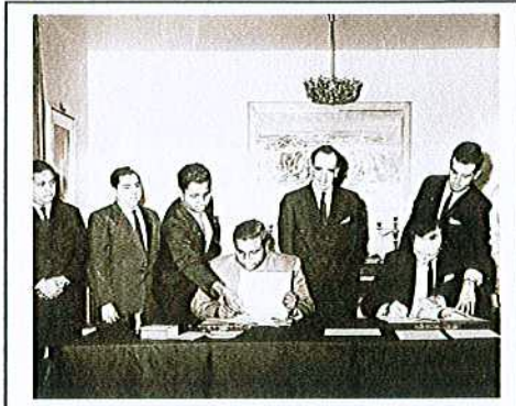
تصویر 3: (صرفاً سرکاری ڈیپارٹمنٹ کے لیے ہی) سرکاری ڈیپارٹمنٹ کے لیے ہی

صرفاً سرکاری ڈیپارٹمنٹ کے لیے ہی 26 جولائی 1965ء کو صرفاً سرکاری ڈیپارٹمنٹ کے لیے ہی سرکاری ڈیپارٹمنٹ کے لیے ہی صرفاً سرکاری ڈیپارٹمنٹ کے لیے ہی (صرفاً سرکاری ڈیپارٹمنٹ کے لیے ہی) صرفاً سرکاری ڈیپارٹمنٹ کے لیے ہی (صرفاً سرکاری ڈیپارٹمنٹ کے لیے ہی) (1990)