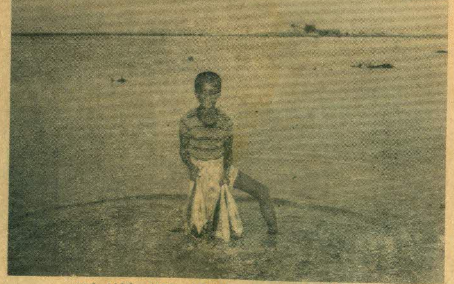
● این تصویر مربوط به کودکانی است که در کنار رودخانه‌ها و دریاچه‌ها زندگی می‌کنند و به ماهی‌گیری اشتغال دارند.

سازماندها و مراکز علمی و فرهنگی در استان تهران سازماندها و مراکز علمی و فرهنگی در استان تهران سازماندها و مراکز علمی و فرهنگی در استان تهران