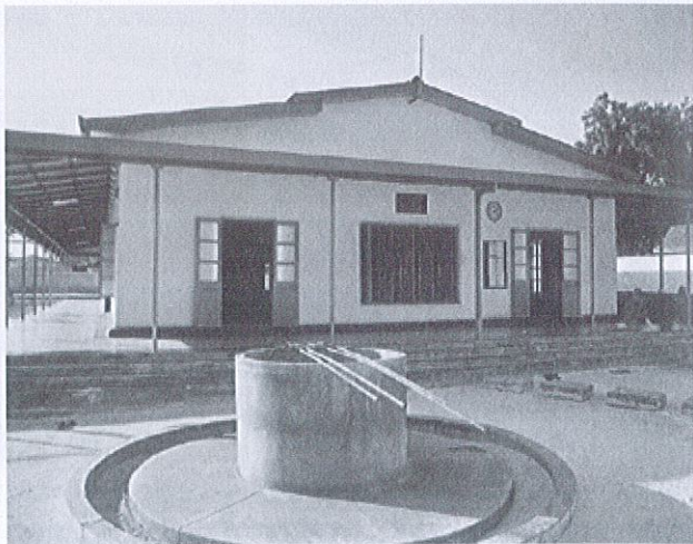
سازمان آبرسانی و فاضلابیتهای شهری، تهران

در این مقاله به بررسی وضعیت آبرسانی و فاضلابیتهای شهری در تهران پرداخته شده است. در ابتدا به اهمیت آبرسانی و فاضلابیتهای شهری در توسعه پایدار و سلامت جامعه اشاره شده است. سپس به بررسی وضعیت فعلی آبرسانی و فاضلابیتهای شهری در تهران پرداخته شده است. در ادامه به بررسی چالشها و مشکلات موجود در زمینه آبرسانی و فاضلابیتهای شهری در تهران پرداخته شده است. در نهایت به بررسی راهکارها و پیشنهادات برای بهبود وضعیت آبرسانی و فاضلابیتهای شهری در تهران پرداخته شده است. در این مقاله به بررسی وضعیت آبرسانی و فاضلابیتهای شهری در تهران پرداخته شده است. در ابتدا به اهمیت آبرسانی و فاضلابیتهای شهری در توسعه پایدار و سلامت جامعه اشاره شده است. سپس به بررسی وضعیت فعلی آبرسانی و فاضلابیتهای شهری در تهران پرداخته شده است. در ادامه به بررسی چالشها و مشکلات موجود در زمینه آبرسانی و فاضلابیتهای شهری در تهران پرداخته شده است. در نهایت به بررسی راهکارها و پیشنهادات برای بهبود وضعیت آبرسانی و فاضلابیتهای شهری در تهران پرداخته شده است.