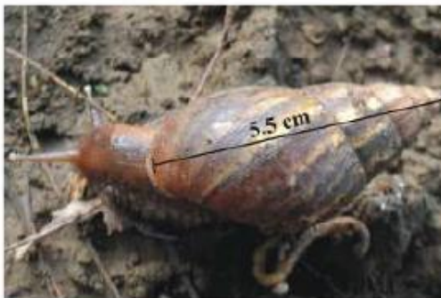
Adult (> 6 months)