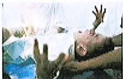
تصویر: 2 کے ساتھ دیکھنے والے

دیکھنے والے کی تصویر میں ایک شخص کی تصویر دکھائی گئی ہے، جس کی تصویر دکھائی گئی ہے۔ اس تصویر میں ایک شخص کی تصویر دکھائی گئی ہے۔ اس تصویر میں ایک شخص کی تصویر دکھائی گئی ہے۔ اس تصویر میں ایک شخص کی تصویر دکھائی گئی ہے۔