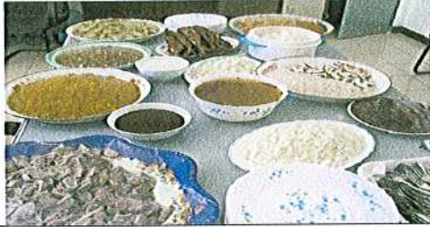
فرضاً: 5 دیہی زندگی اور معاشرتی تبدیلیاں کی مثال کے طور پر شادی کی رسموں کی تبدیلیاں کی وضاحت کی گئی ہے۔

دیہی زندگی اور معاشرتی تبدیلیاں کی مثال کے طور پر شادی کی رسموں کی تبدیلیاں کی وضاحت کی گئی ہے۔