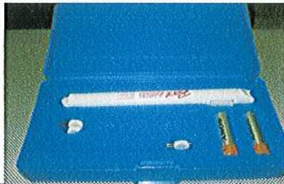
تاریخ: 17 این تصویر نشان‌دهنده ابزارها و مواد دندانپزشکی است که در این پژوهش استفاده شده است.