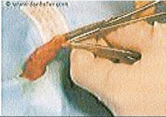
شکل 13: گرفتن نمونه با سنجش و بازرسی

در سنجش بازرسی، نمونه‌ها در دمای اتاق و در معرض نور طبیعی قرار می‌گیرند. در سنجش بازرسی، نمونه‌ها در دمای اتاق و در معرض نور طبیعی قرار می‌گیرند. در سنجش بازرسی، نمونه‌ها در دمای اتاق و در معرض نور طبیعی قرار می‌گیرند. در سنجش بازرسی، نمونه‌ها در دمای اتاق و در معرض نور طبیعی قرار می‌گیرند.