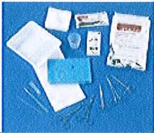
تاریخ: 18 این تصویر نشان‌دهنده ابزارها و مواد دندانپزشکی است که در این پژوهش استفاده شده است.

نتیجه گیری این پژوهش آنست که استفاده از مواد پلاستیکی در دندانپزشکی، به دلیل سادگی و سهولت استفاده، در کنار مواد فلزی، جایگاه ویژه‌ای دارد. با توجه به نتایج این پژوهش، می‌توان گفت که استفاده از مواد پلاستیکی در دندانپزشکی، می‌تواند به بهبود کیفیت درمان و کاهش هزینه‌ها منجر شود. همچنین، استفاده از مواد پلاستیکی در دندانپزشکی، می‌تواند به کاهش خطر عفونت و بهبود سلامت بیمار منجر شود. (تاریخ: 16، 17، 18) و سایر منابع معتبر دندانپزشکی.