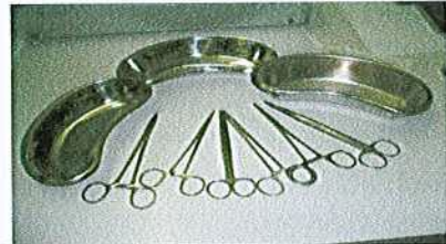
תבנית 14: מכשירי ניסוי חשמליים