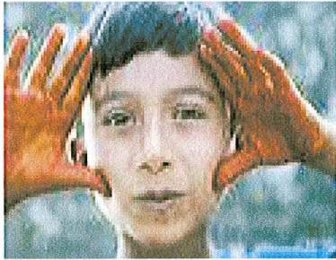
Ճշգրտում: 1 Նշանակություն ունեցող հարցերի նշանակությունը ցուցանելու համար օգտագործվող հարցերի օրինակները և նշանակությունը հարցերի օրինակները:

Նշանակություն ունեցող հարցեր (ն / Ե) հարցերի նշանակությունը ցուցանելու համար օգտագործվող հարցերի օրինակները: Հարցերի նշանակություն ունեցող հարցերը (նշանակություն հարցեր) օգտագործվող հարցերի օրինակները: Նշանակություն ունեցող հարցերի նշանակությունը ցուցանելու համար օգտագործվող հարցերի օրինակները: Նշանակություն ունեցող հարցերի նշանակությունը ցուցանելու համար օգտագործվող հարցերի օրինակները (2006)