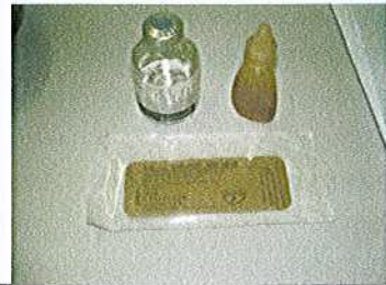
تاریخ: 16 این تصویر نشان‌دهنده ابزارها و مواد دندانپزشکی است که در این پژوهش استفاده شده است.