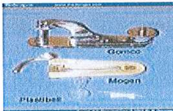
תבנית 15: מכשירי ניסוי חשמליים