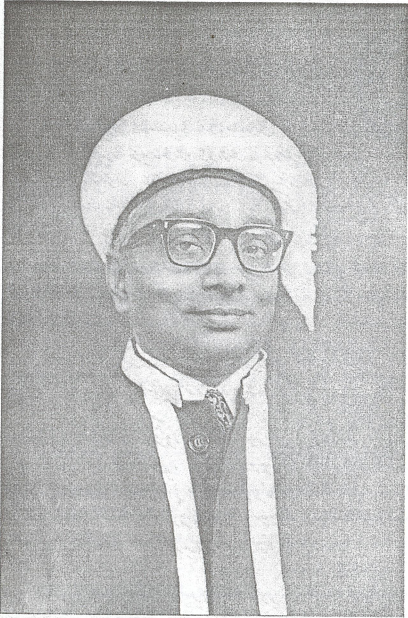
پروفیسر ڈی. اے. خان 01 دسمبر 1915ء - 01 دسمبر 1989ء