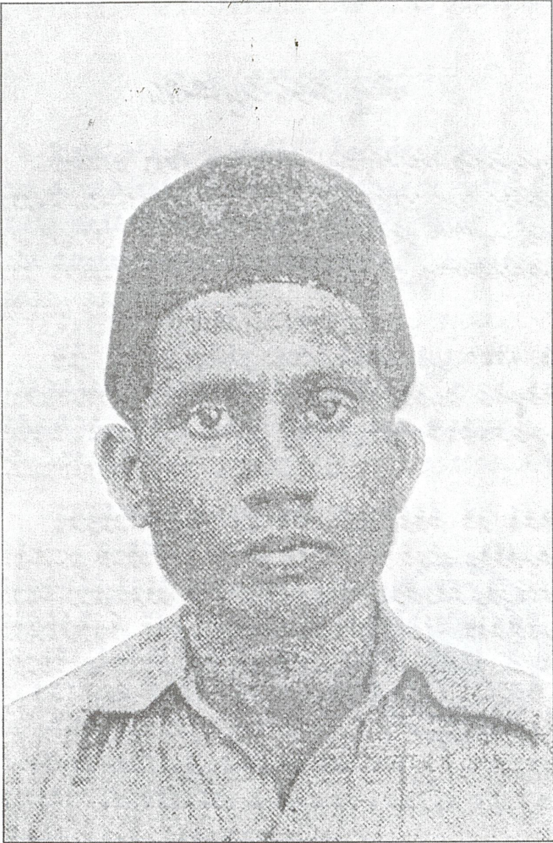
پروفیسر ڈاکٹر ایف بی - 10 جنوری 1988ء